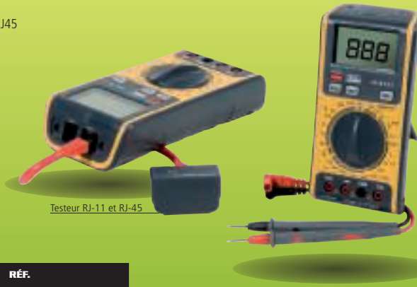
Testeur RJ-11 et RJ-45