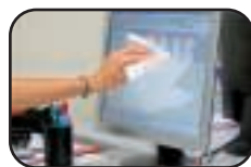
TOUT USAGE !