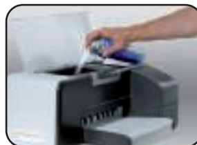
FACILE À UTILISER !

Spécial imprimantes ! • Nettoyant puissant pour dissoudre l'encre sur les pièces d'imprimantes. • Idéal pour les têtes d'impression, les galets, les prises papiers et les rouleaux