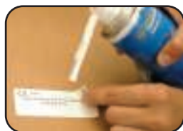
FACILE À UTILISER !

Élimine les traces de colles ! • Idéal pour décoller les étiquettes en papier. • Élimine les résidus de colle.