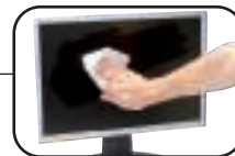
SANS TRACE !