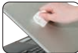
SANS TRACE !

Lingettes pré-imprégnées d'une solution biodégradable pour le nettoyage des surfaces plastiques et vitrées du matériel informatique et bureautique