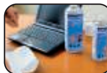
SANS TRACE !