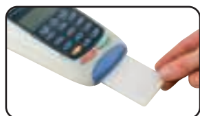
CARTES PRÉ-IMPRÉGNÉE !

Spécial lecteurs de cartes magnétiques ! Indispensable pour l'entretien des lecteurs de cartes magnétiques.