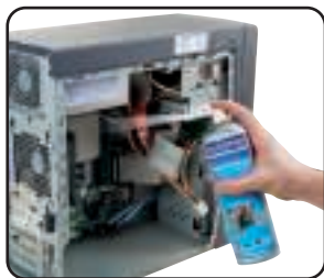
GUIDE DE PRÉCISION ! Sans dessus dessous

Souffleurs d'air idéal pour le nettoyage et l'entretien de toutes les surfaces délicates et difficiles d'accès